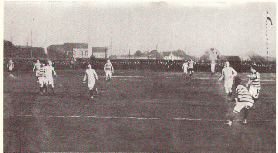
Ein Bild aus der Spielsaison 1911/1912, als der Meidericher SV gegen den VfB Ruhrort antrat. Man beachte die wehende Fahne und die Zuschauerkulisse.

Kein Werbefachmann hätte für die Meidericher mit einer noch so ausgefallenen Idee besser werben können, als es das Torverhältnis von 113:12 tat. Die ganze deutsche Sportwelt wurde auf die „Zebras“ aufmerksam und es war nicht mehr schwer, erstklassige Gegner zu verpflichten. Am Karfreitag 1914 war die englische Elf Dulwich-