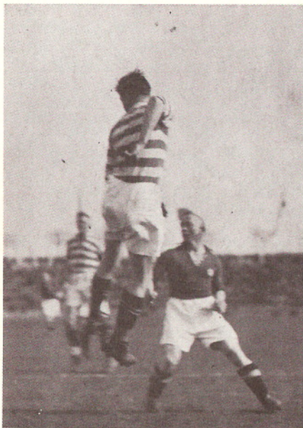
Eine Spielszene aus dem Jahr 1925 vom Treffen MSV gegen Duisburger Fußballverein 08.

Im nächsten Jahr, 1924 also, holte sich der Meidericher Spielverein den Krupp-von-Bohlen-Halbach-Pokal, der