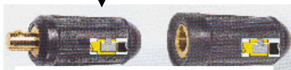
Schweißkupplung Buchsen – und Steckerteil Art. 35261 + 35251