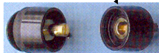
Schweißerkupplung Buchsen – und Steckerteil für den Einbau Art. 35571