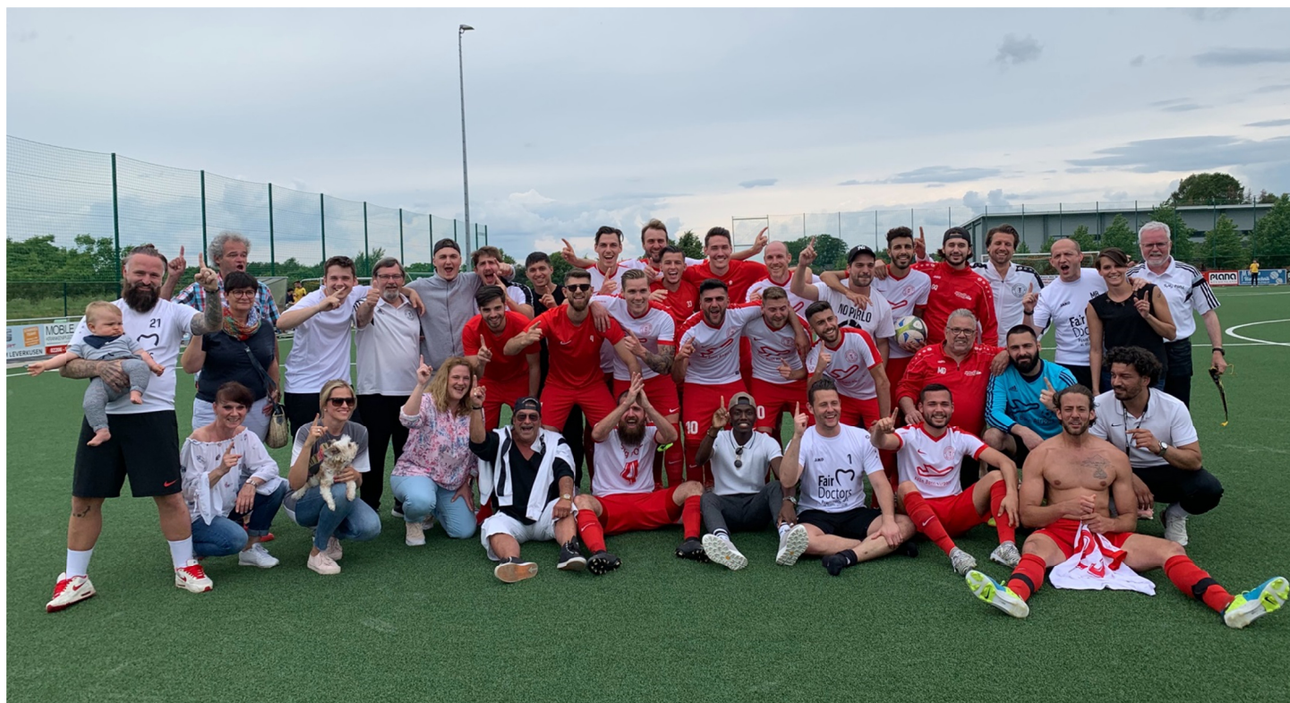
Dem Aufstieg folgte die Meisterschaft

Am 6. Spieltag sprang die SpVg. Porz an die Tabellenspitze der Bezirksliga Staffel 1 und ließ sich seitdem nicht mehr vom Platz an der Sonne verdrängen. Nun steht fest, dass die Porzer auch am Ende der Saison oben stehen werden. Das 2:2-Unentschieden beim TuS Marialinden bescherte ihnen vorzeitig die Meisterschaft.